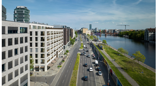
Das PURE Living an der Spree