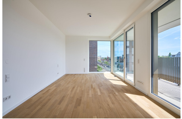
Hauptschlafzimmer mit Zugang zur zweiten Terrasse