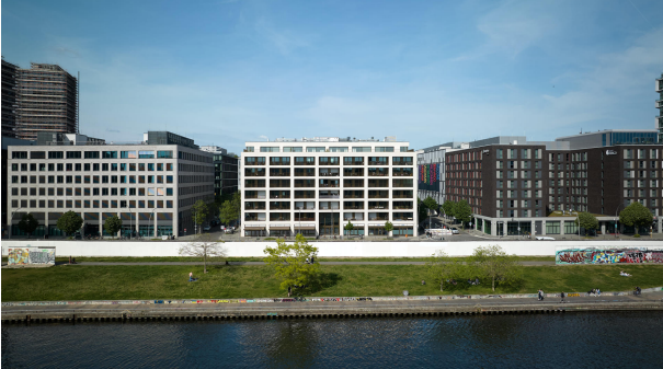
PURE Living an der Spree