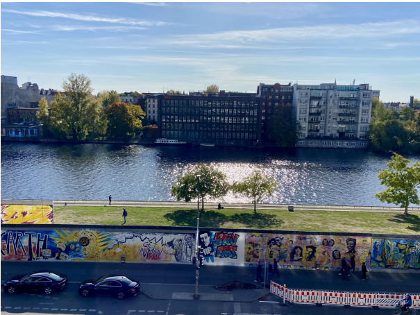
Einzigartiger Ausblick von den Terrassen