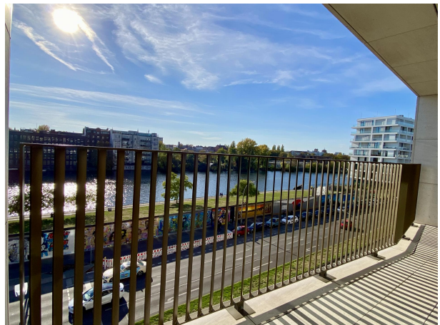
Zwei traumhafte Terrassen