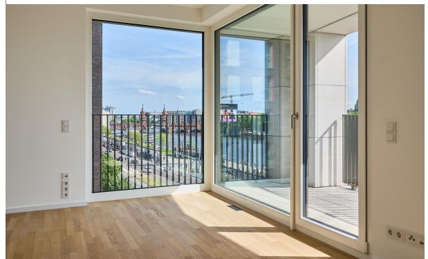
Spektakulärer Blick mit Zugang zu einer der beiden Terrassen