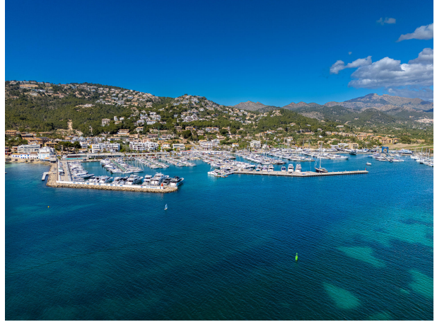
06 Drone Villa Italia