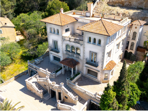
05 Drone Villa Italia