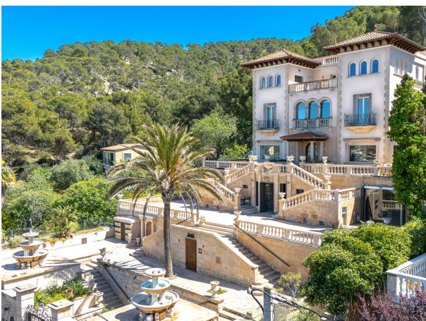
03 Drone Villa Italia