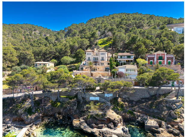
02 Drone Villa Italia