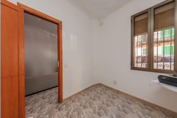
Ground floor living room