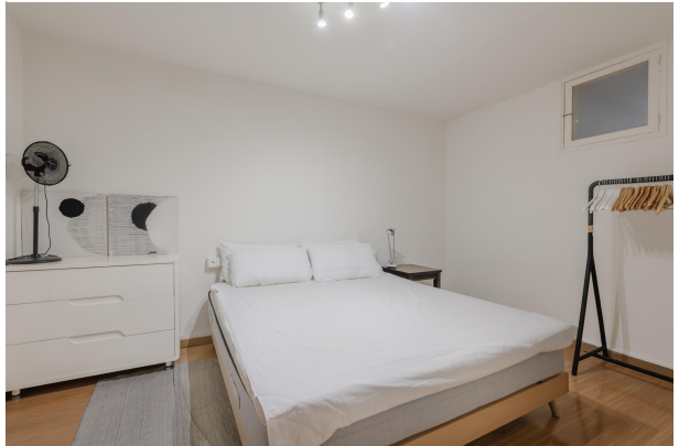
1st floor bedroom I