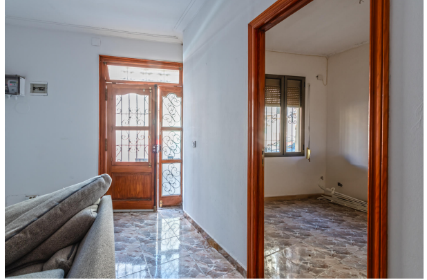
Ground floor living room