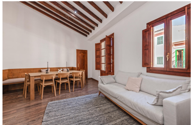
1st floor living area