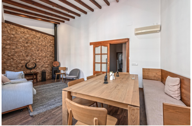
1st floor living area