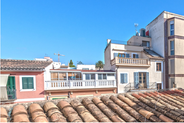
1st floor living area