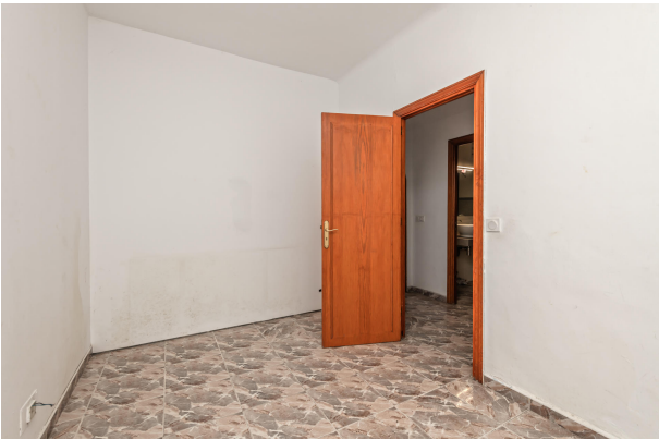
Ground floor bedroom loom