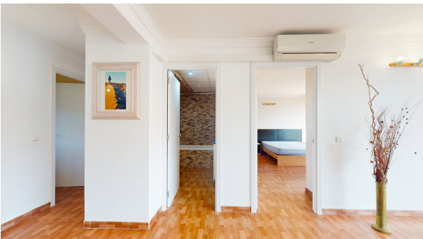
main bedroom en Suite