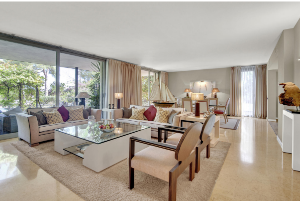
Helles und schönes Wohnzimmer