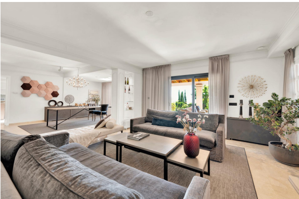
Sala de estar de diseño moderno