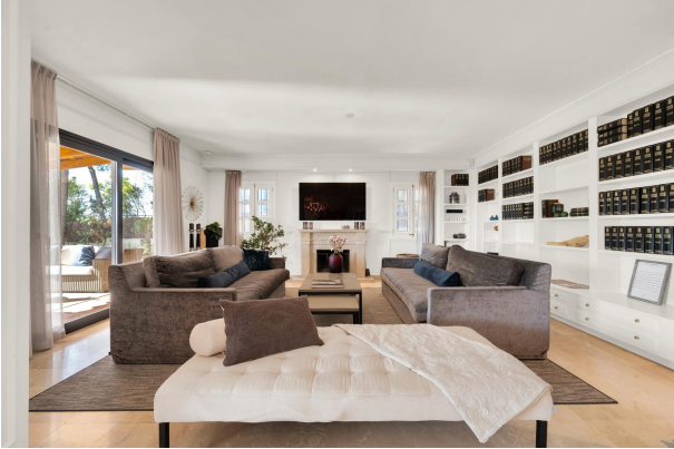
Sala de estar creativa