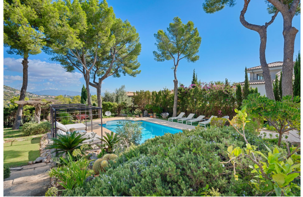
Hermosa área exterior con una gran piscina