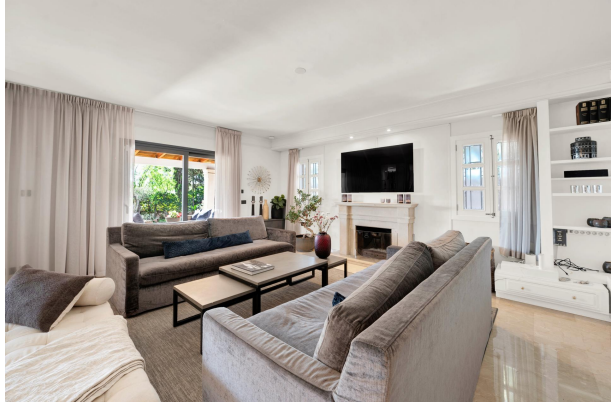
Sala de estar acogedora