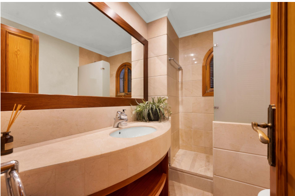
Offenes und helles Badezimmer