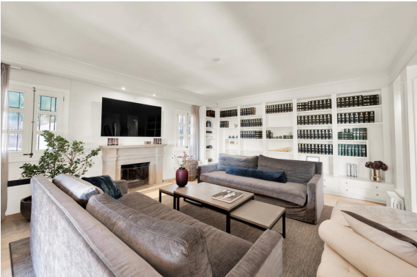
Sala de estar luminosa