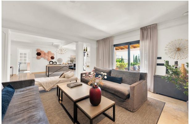
Sala de estar moderna