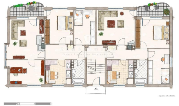
EG und OG