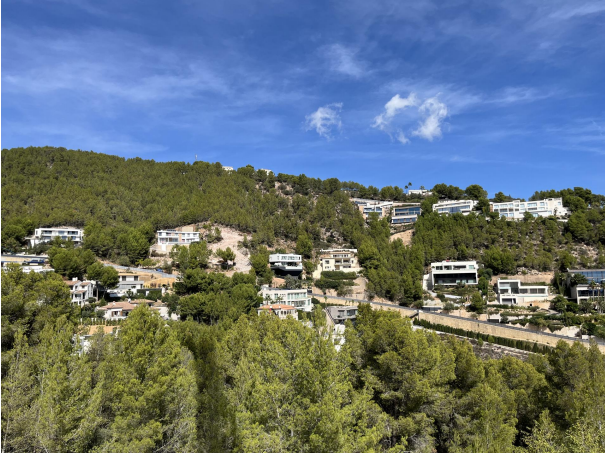
Plot and street