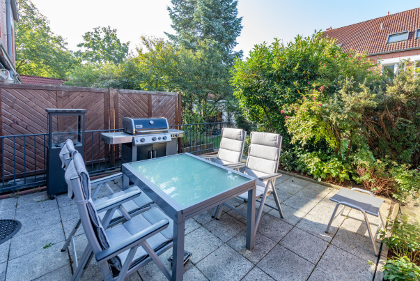
Terrasse s/w Ausrichtung