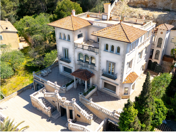
05 Drone Villa Italia