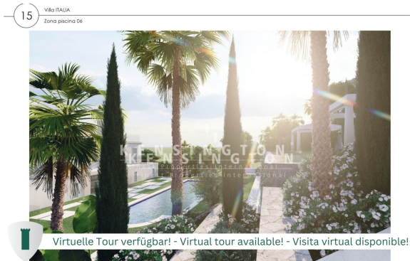
Virtual Tour Banner Cover picture (2362 x 1535px)