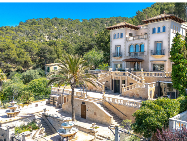
03 Drone Villa Italia