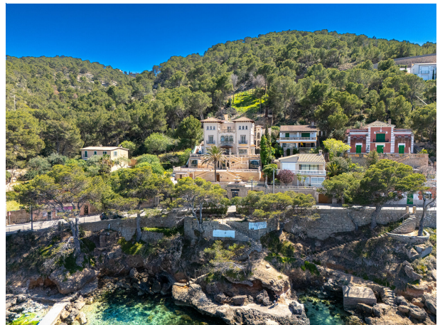
02 Drone Villa Italia