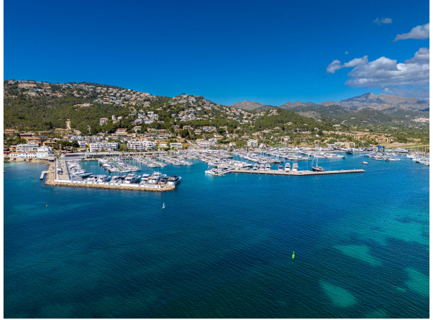
06 Drone Villa Italia