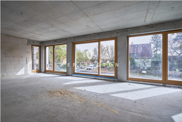
Schlafzimmer und Flur