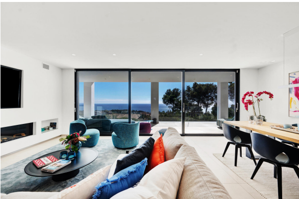
Living room with sea views