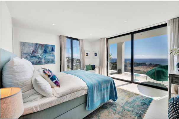
Master bedroom with panoramic view