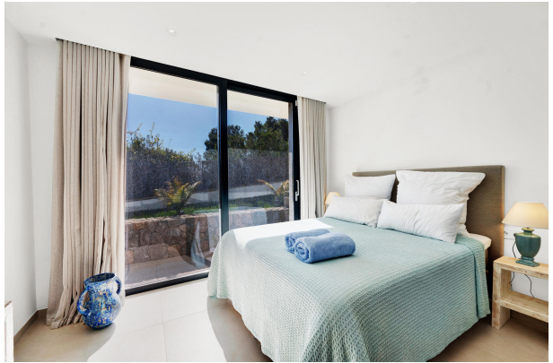
Bedroom in a sea view villa in Costa den Blanes