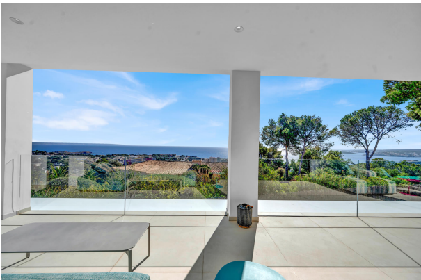
Terrace with sea views