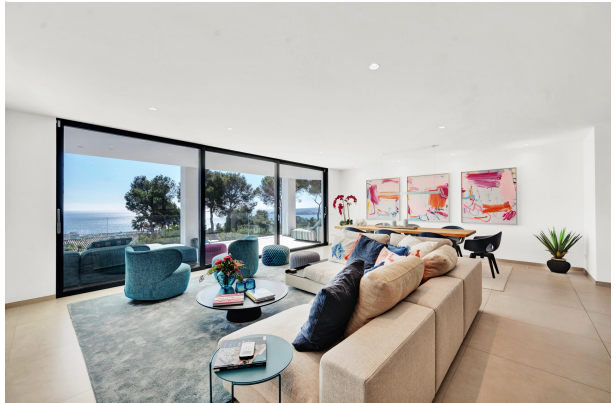
Sea view villa