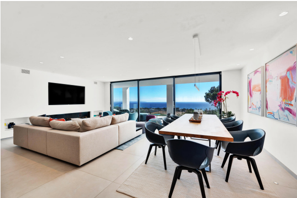
Living room in a villa