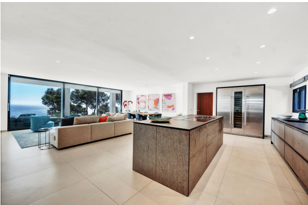
Villa for sale in Costa den Blanes