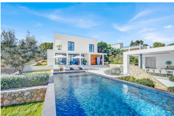
Modern sea view villa