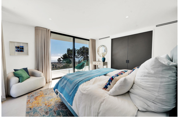
Master bedroom with sea views