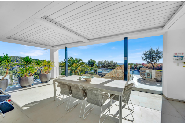
Pool terrace in Costa den Blanes