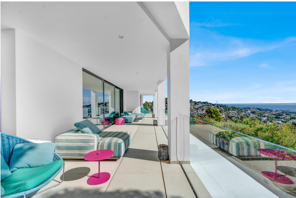
Stunning sea view terrace