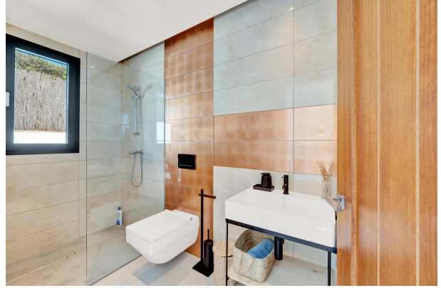
Bathroom by pool terrace