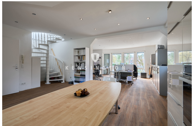
Blick in den Wohnbereich