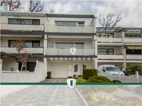
**Titelbild_2_KBR_172_Reihenmittelhaus in Seevetal