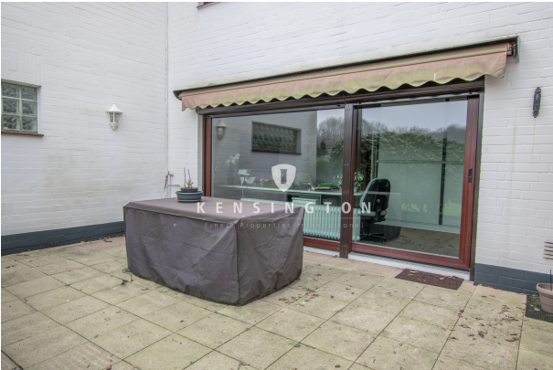
Terrasse_KBR_172_Reihenmittelhaus in Seevetal