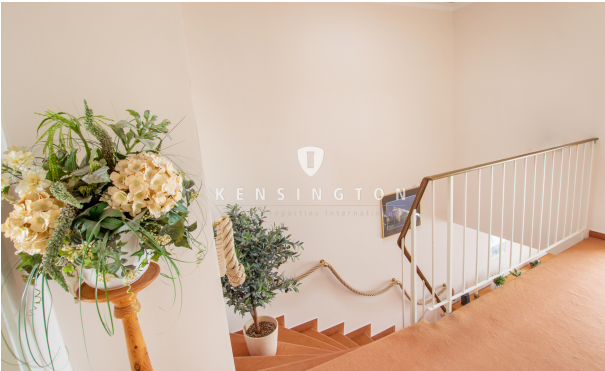
*Treppenaufgang zum OG_KBR_172_Reihenmittelhaus in Seevetal