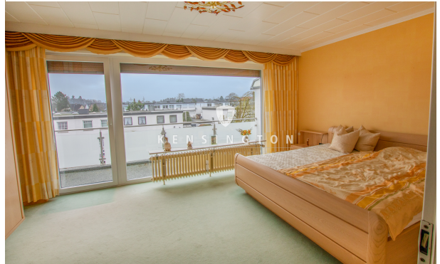
Schlafzimmer OG_KBR_172_Reihenmittelhaus in Seevetal