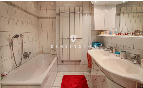
Badezimmer OG_KBR_172_Reihenmittelhaus in Seevetal