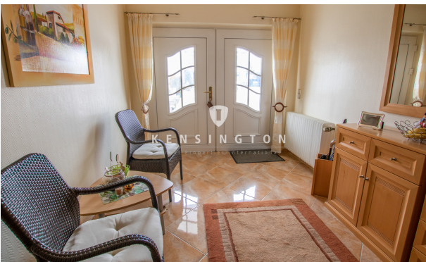
Eingangsbereich_KBR_172_Reihenmittelhaus in Seevetal