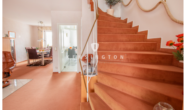
Wohnzimmer Ansicht 2_KBR_172_Reihenmittelhaus in Seevetal

K E N S I N G T O N Fines Properties International