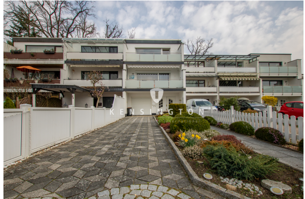
**Einfahrt_KBR_172_Reihenmittelhaus in Seevetal