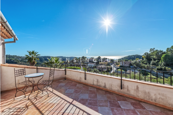
Guest house - Master terrace