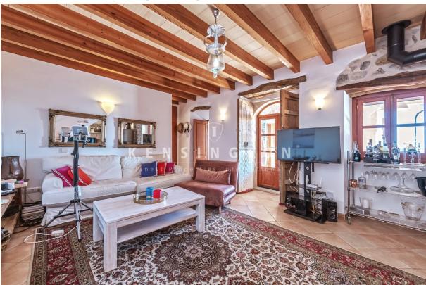
Main house - Living/dining/kitchen