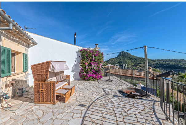
Main house - Porch