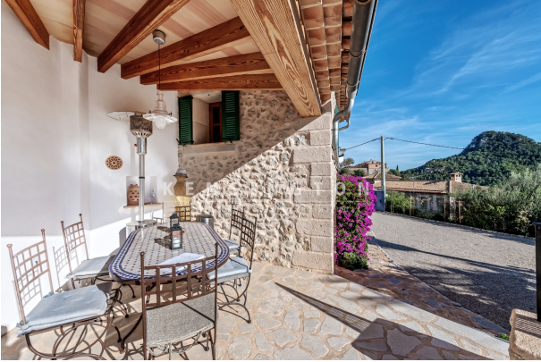
Guest house - Porch