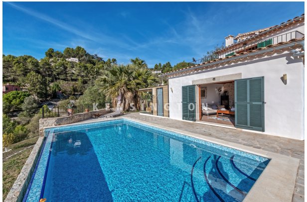
Pool & guest house