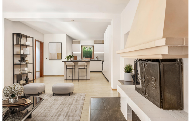
Blick in die Küche (Einrichtungsbeispiel)