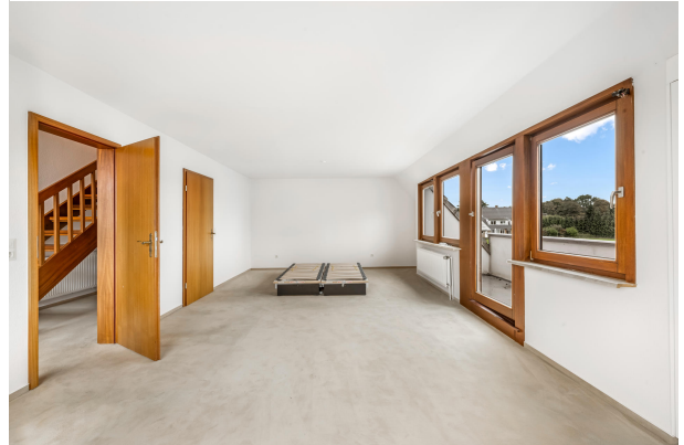
Schlafzimmer mit Zugang zum Balkon