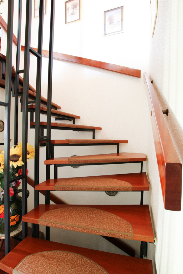
*Zimmer 1 - OG