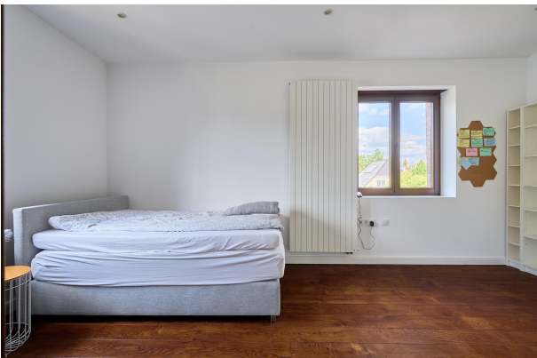
Schlaf oder Kinderzimmer