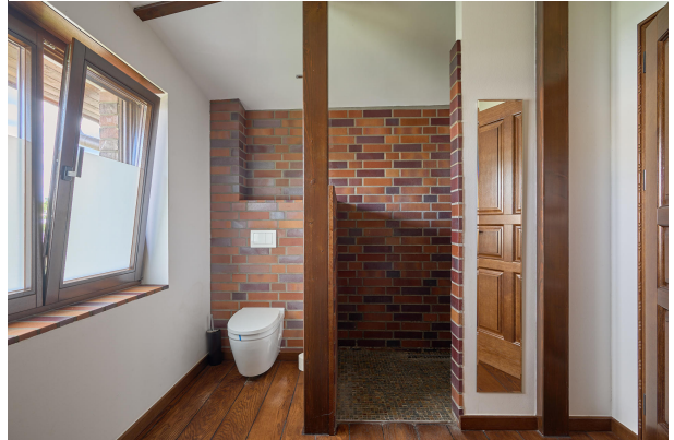
Hochwertige Handarbeit, nicht nur im Badausbau