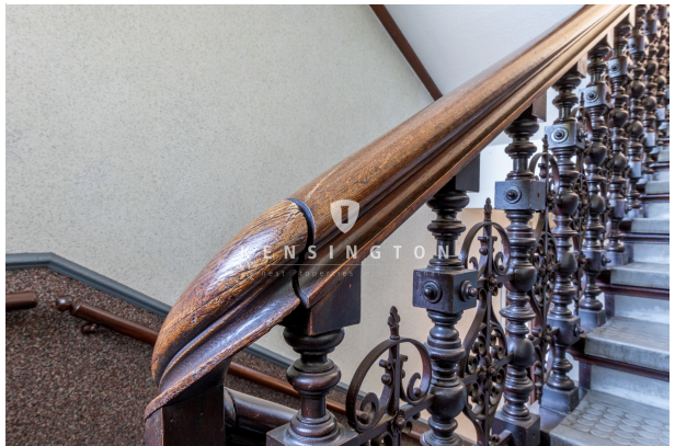
Alte Stilelemente im Treppenhaus_KBR_503