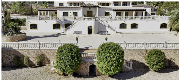
17 - KPI1200 - Finca en venta - Finca zu verkaufen - Finca for sale - Finca te koop - www.kensington-ibiza.com - Noelle Politiek