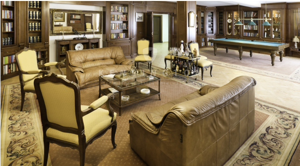
24 - KPI1200 - Finca en venta - Finca zu verkaufen - Finca for sale - Finca te koop - www.kensington-ibiza.com - Noelle Politiek