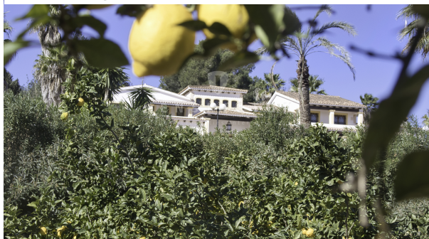
19 - KPI1200 - Finca en venta - Finca zu verkaufen - Finca for sale - Finca te koop - www.kensington-ibiza.com - Noelle Politiek