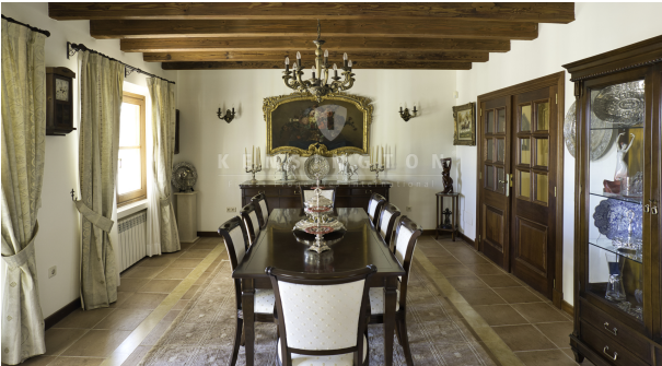
26 - KPI1200 - Finca en venta - Finca zu verkaufen - Finca for sale - Finca te koop - www.kensington-ibiza.com - Noelle Politiek