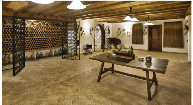
25 - KPI1200 - Finca en venta - Finca zu verkaufen - Finca for sale - Finca te koop - www.kensington-ibiza.com - Noelle Politiek