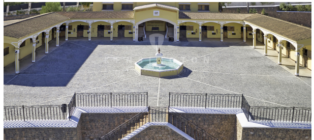
07 - KPI1200 - Finca en venta - Finca zu verkaufen - Finca for sale - Finca te koop - www.kensington-ibiza.com - Noelle Politiek