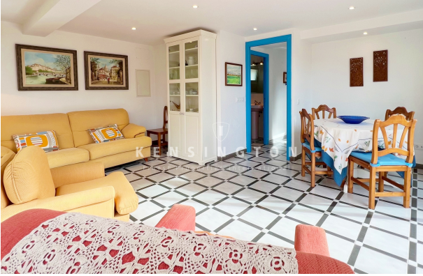
Living R 1