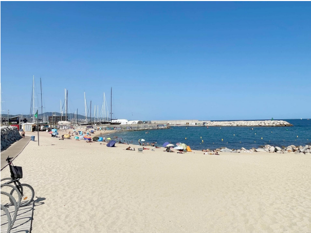
WhatsApp Image 2024-08-29 at 12.17.10 (1)