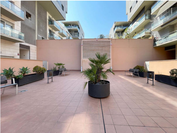
WhatsApp Image 2024-08-06 at 10.07.25