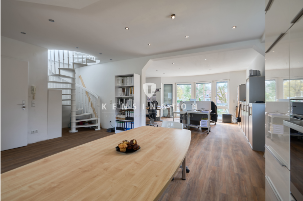
Blick in den Wohnbereich