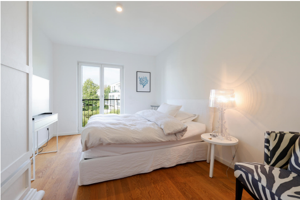
Schlafzimmer 3 im Obergeschoss