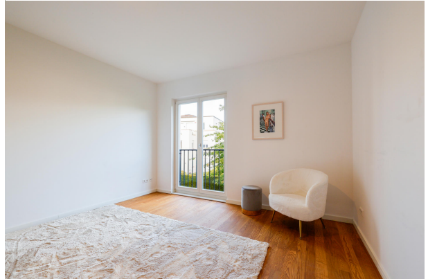
Schlafzimmer 2 im Obergeschoss