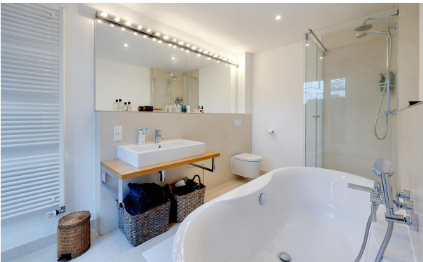
Badezimmer im Erdgeschoss angrenzend am Schlafzimmer 1