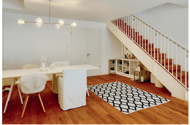
Essbereich mit Treppenaufgang