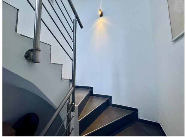
Treppenaufgang Obergeschoss Einlieger