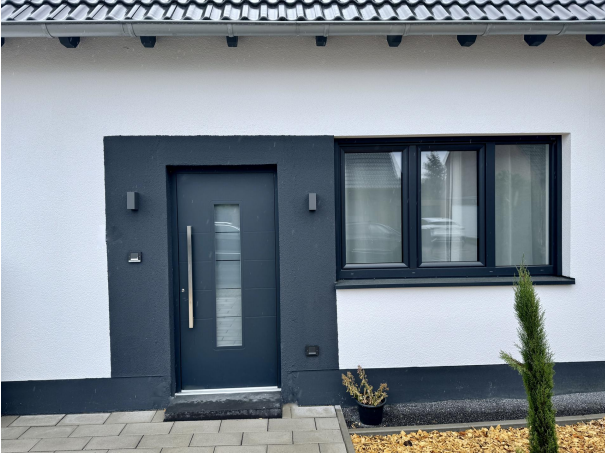
Eingangsbereich einlieger Frontseite