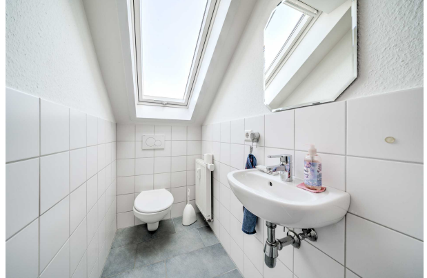
EG (unverbindliche Illustration)