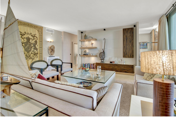
Gemütliches und grosses Wohnzimmer