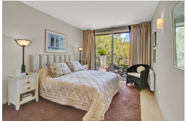
Schönes und grosses Schlafzimmer