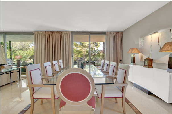
Schöner und heller Essbereich