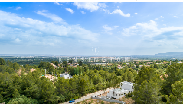
Grundstück Bunyola Mallorca-view 6m high