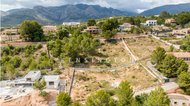
Grundstück Bunyola Mallorca