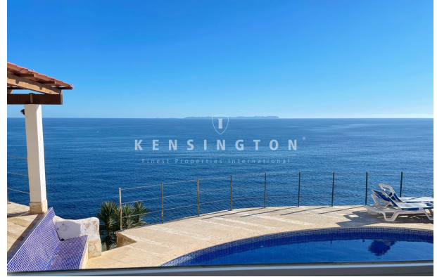
Copy of Virtual Tour Banner Cover picture (2362 x 1535px) (1)