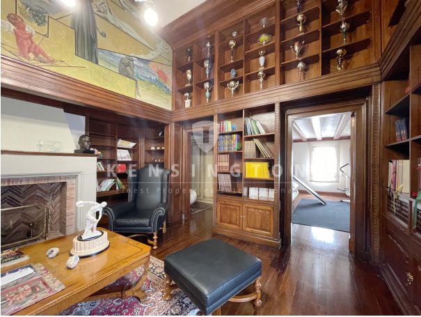
Gimnasio - altillo