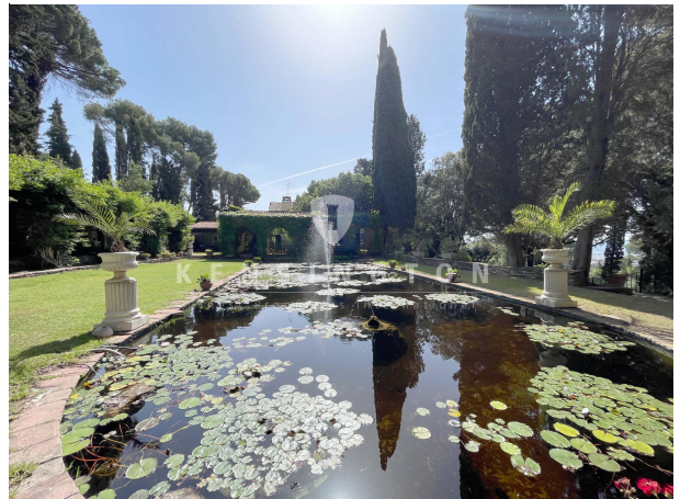
Jardines - Paisajista Nicolás María Rubió Tudurí