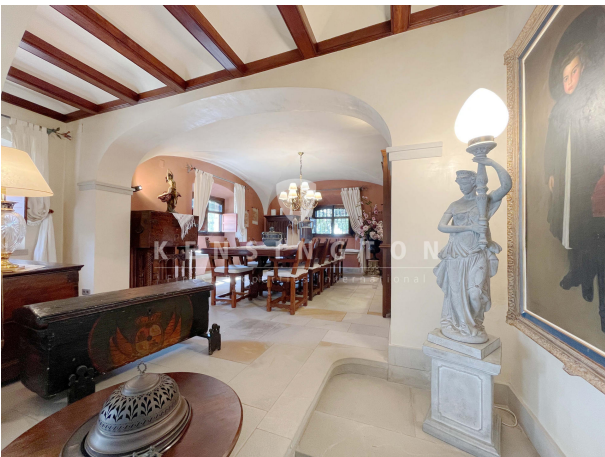
Comedor - bodega