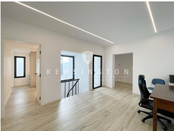
Vestidor - suite en planta