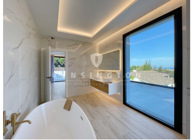
Vistas desde terraza