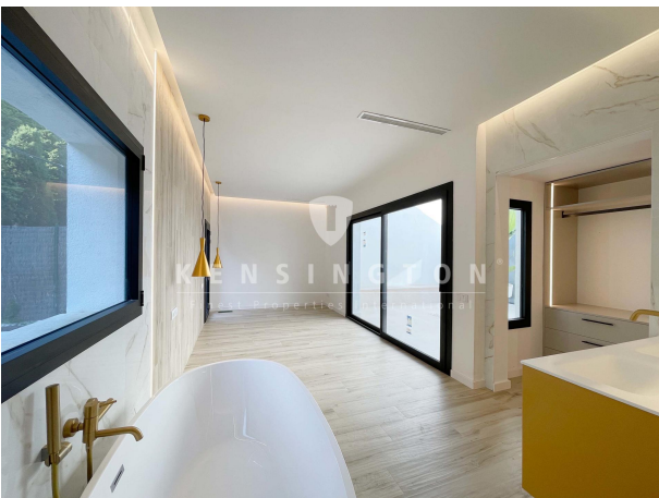
Terraza interior - suite en planta