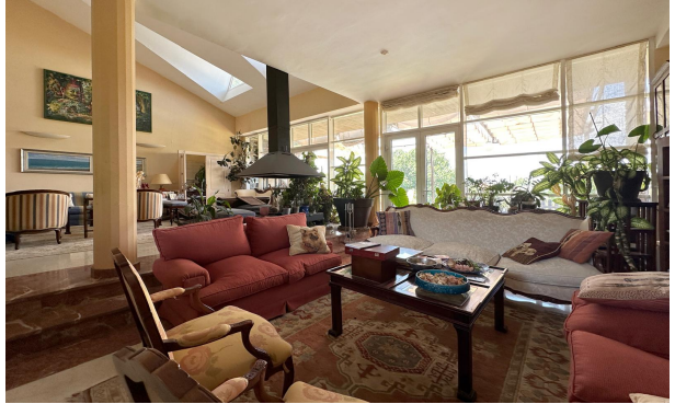
6 Imagen de WhatsApp 2024-10-17 a las 11.13.10_1c410b96