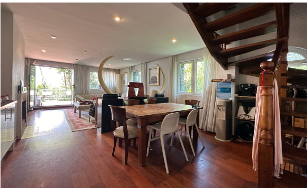
9 Imagen de WhatsApp 2024-10-17 a las 11.07.42_1a72f774