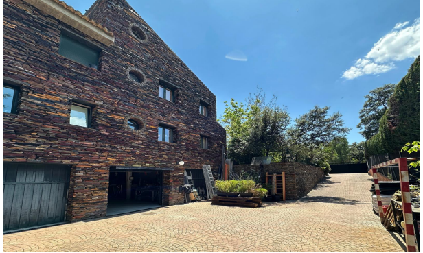
Imagen de WhatsApp 2024-10-17 a las 11.13.14_fe83e34f