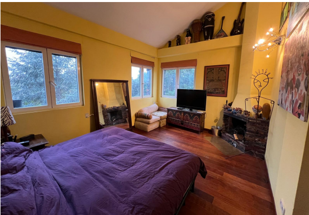
Imagen de WhatsApp 2024-10-17 a las 11.13.20_b42a22ea