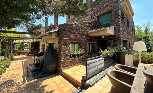
Imagen de WhatsApp 2024-10-17 a las 11.13.18_8c45a570