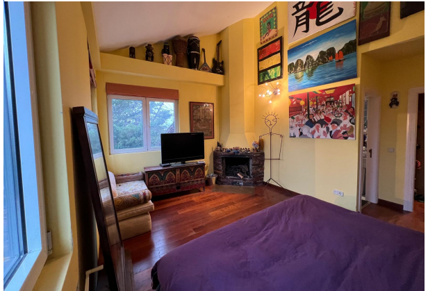
13 Imagen de WhatsApp 2024-10-17 a las 11.07.44_4ed26d00