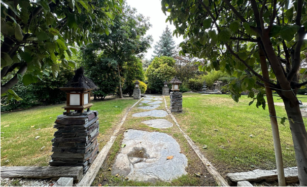
Imagen de WhatsApp 2024-10-17 a las 11.13.14_8885978e