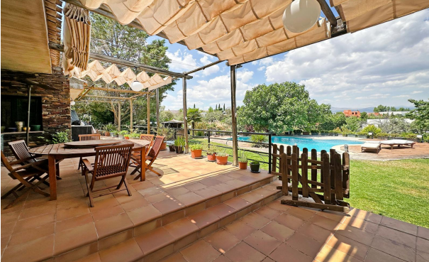
1 Imagen de WhatsApp 2024-10-17 a las 11.13.19_71d7818e