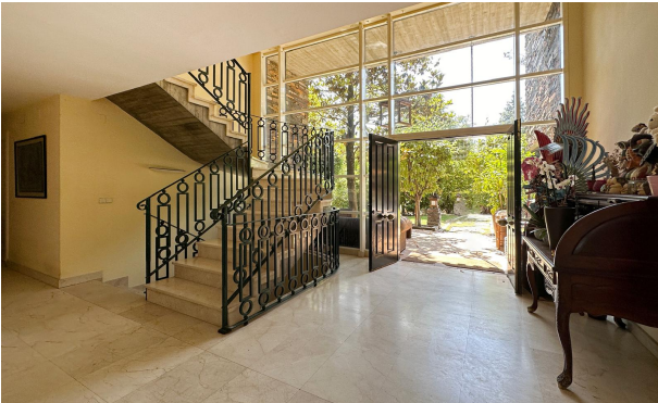
7 Imagen de WhatsApp 2024-10-17 a las 11.13.13_26727103