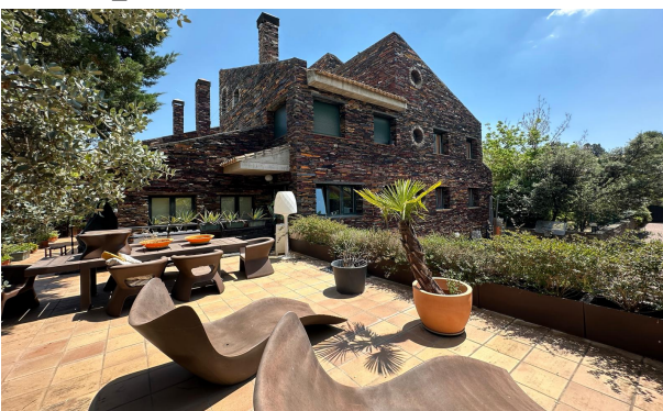
3 Imagen de WhatsApp 2024-10-17 a las 11.13.09_1e9cbd82