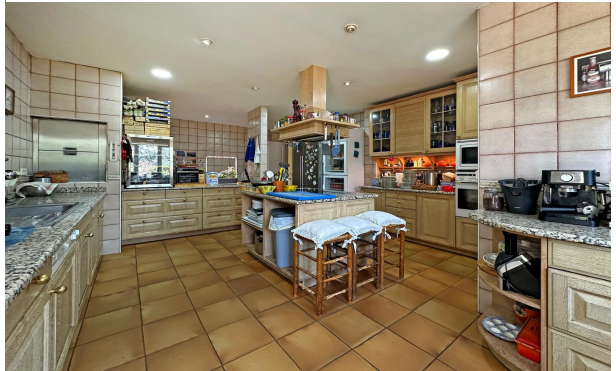
8 Imagen de WhatsApp 2024-10-17 a las 11.13.16_e5f87021