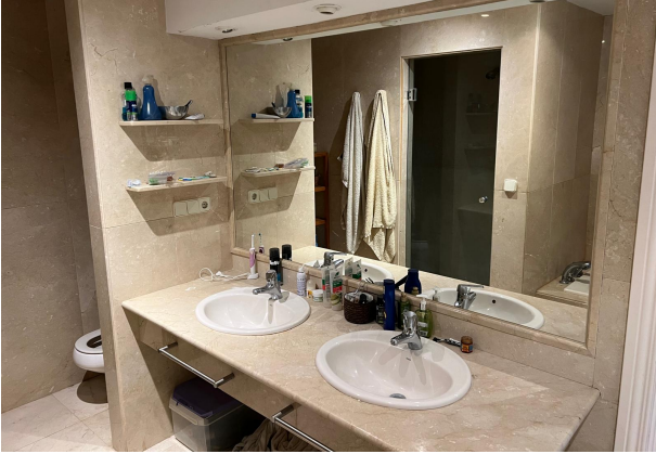
Imagen de WhatsApp 2024-10-17 a las 11.13.19_344114f6