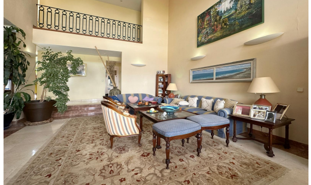
16 Imagen de WhatsApp 2024-10-17 a las 11.13.11_e8777f25