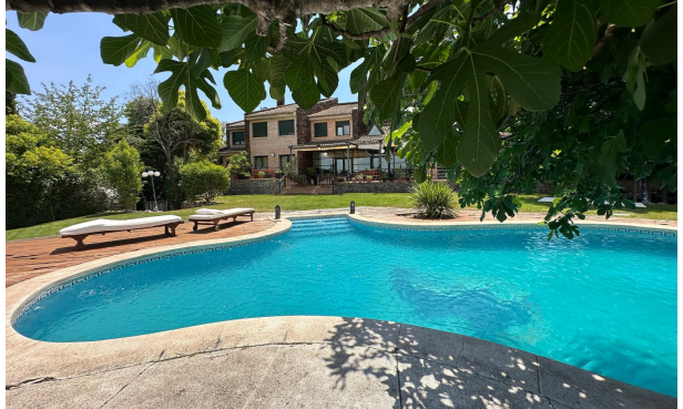
Imagen de WhatsApp 2024-10-17 a las 11.13.19_d6ba5310