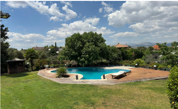
Imagen de WhatsApp 2024-10-17 a las 11.13.20_83fc19a7