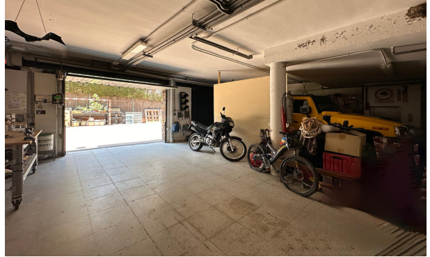
21 Imagen de WhatsApp 2024-10-17 a las 11.13.13_fe2dce30