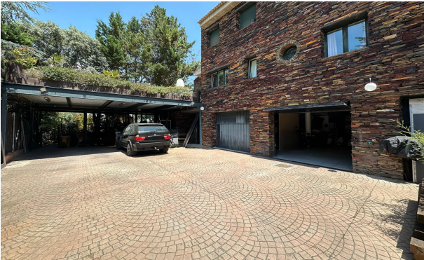
Imagen de WhatsApp 2024-10-17 a las 11.13.09_e0db2095