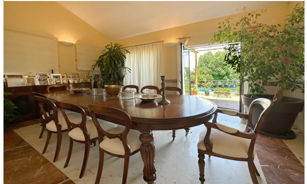
Imagen de WhatsApp 2024-10-17 a las 11.13.20_c2879017