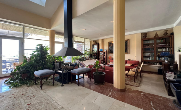
20 Imagen de WhatsApp 2024-10-17 a las 11.13.13_0eab0fc1