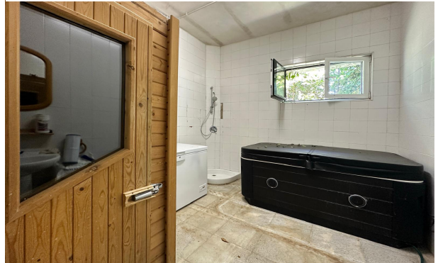
Imagen de WhatsApp 2024-10-17 a las 11.13.13_944e9ac0