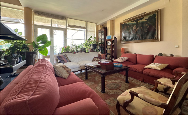
5 Imagen de WhatsApp 2024-10-17 a las 11.13.11_9a47fd17