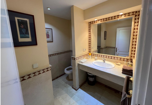
15 Imagen de WhatsApp 2024-10-17 a las 11.13.11_3384eeb8