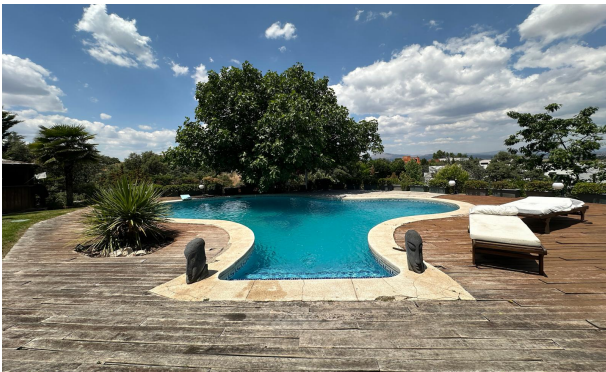
18 Imagen de WhatsApp 2024-10-17 a las 11.13.12_0c9c49c4