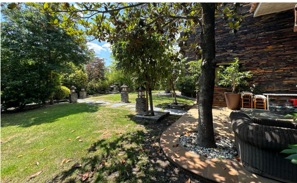
Imagen de WhatsApp 2024-10-17 a las 11.13.17_c7edede3