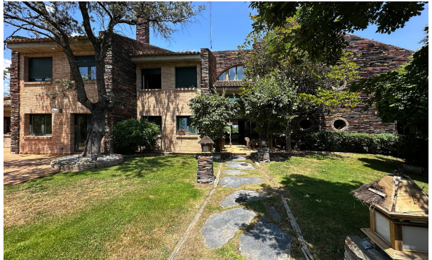
Imagen de WhatsApp 2024-10-17 a las 11.13.17_69ff8871