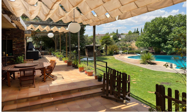
11 Imagen de WhatsApp 2024-10-17 a las 11.07.43_216d89e3