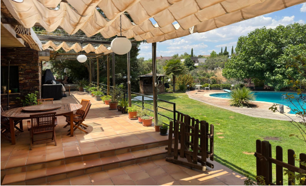
Imagen de WhatsApp 2024-10-17 a las 11.13.18_d4154509