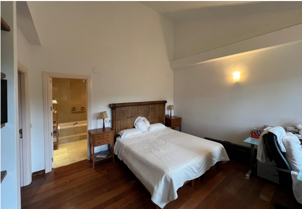
12 imagen de WhatsApp 2024-10-17 a las 11.07.44_3e301862