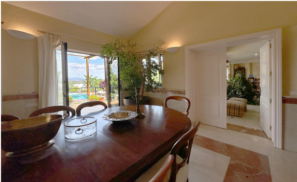
17 Imagen de WhatsApp 2024-10-17 a las 11.13.11_fcdd3647