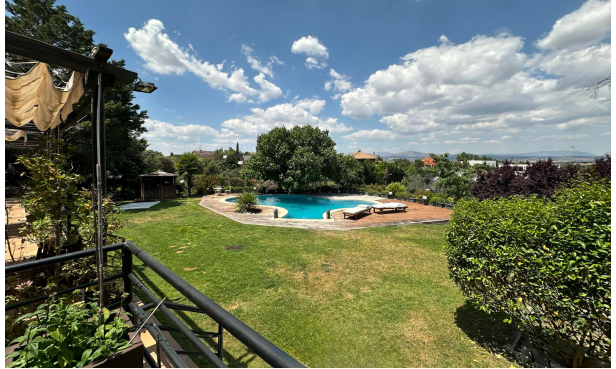
Imagen de WhatsApp 2024-10-17 a las 11.13.18_127da4ff