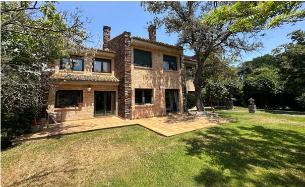
Imagen de WhatsApp 2024-10-17 a las 11.13.16_ac82748c