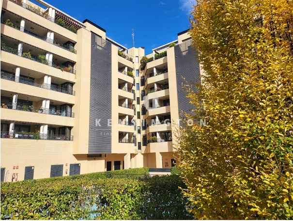
urba horizontal 2