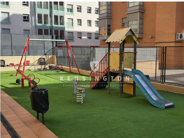
infantiles horizontal 1