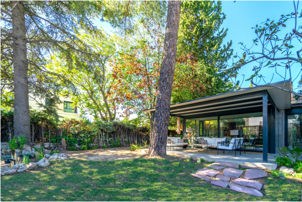
PB (4) 02