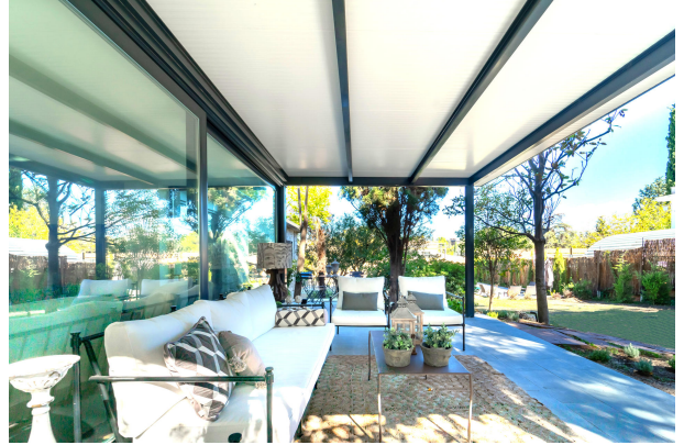
PB (7) 02