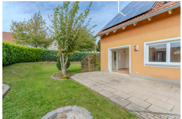
So könnte Ihr neuer Wohnbereich aussehen