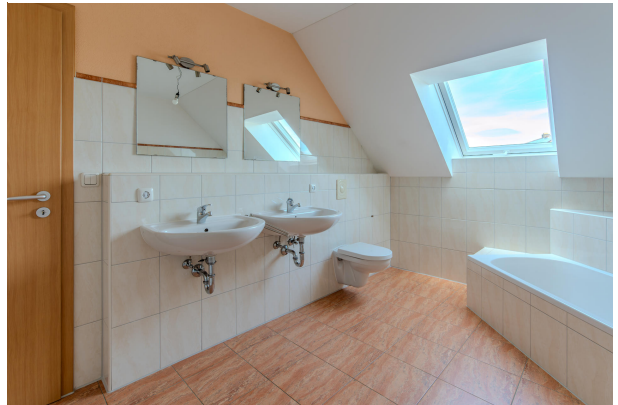
2. sonniges Zimmer im DG