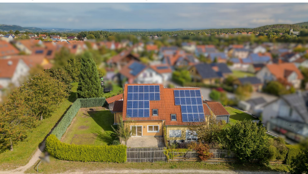
Ihre sonnige DHH!