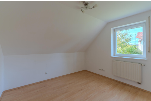
2. sonniges Zimmer im DG