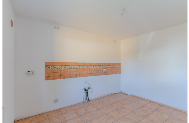
Zur individuellen Gestaltung!