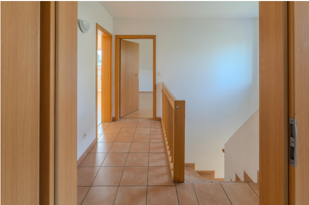
Geräumiger Flur im DG