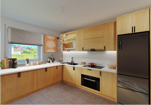
Einrichtungsbeispiel neue Küche!