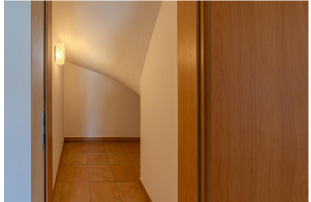
Praktischer Stauraum unter der Treppe