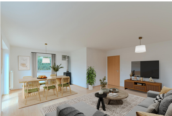
So könnte Ihr neuer Wohnbereich aussehen