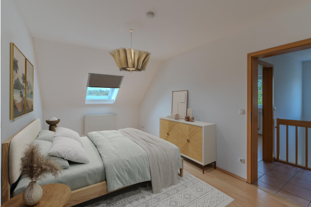
Gemütlich und ruhig!