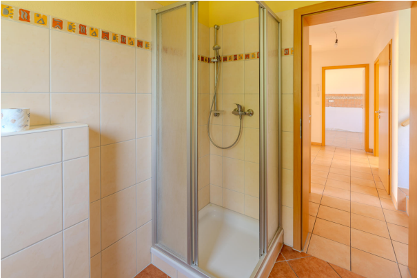
Inklusive Dusche im EG