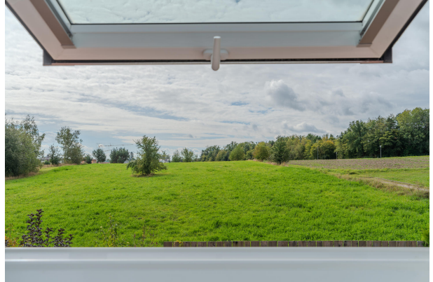
Wunderbarer Blick inklusive!