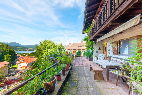
Terrasse mit Blickrichtung zum Berg