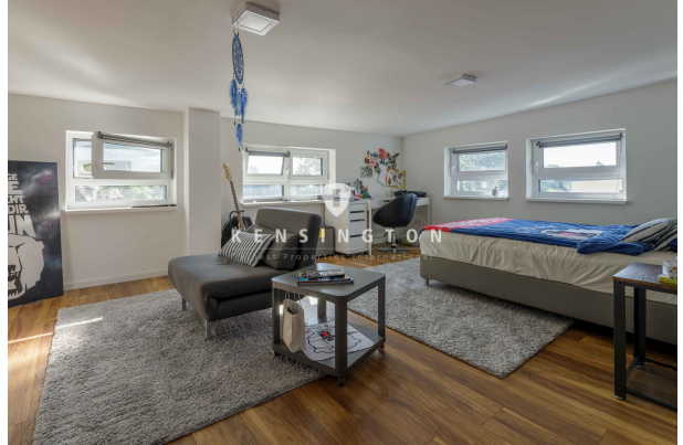
Hobbyraum (beheizt mit Fußbodenheizung)