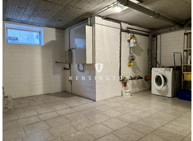
Kellergeschoss Raum 1