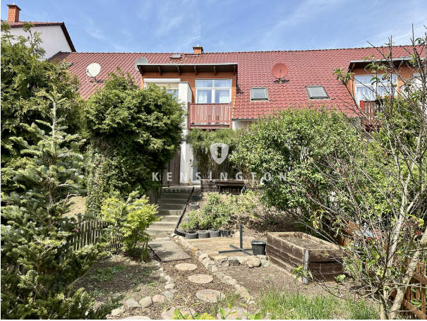
Rückseite Haus/ Garten