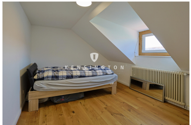
Gästezimmer im DG