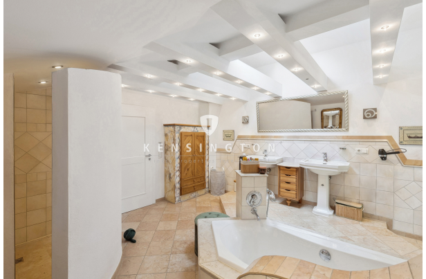
Masterbad OG 1.0