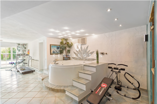
Whirlpool/Fitness UG 1.0