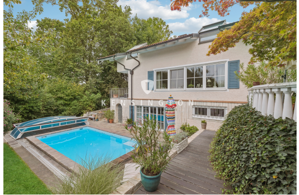
Außenansicht mit Pool 1.0