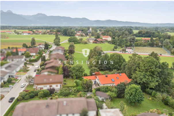
Luftaufnahme mit Blick in die Berge 7.0