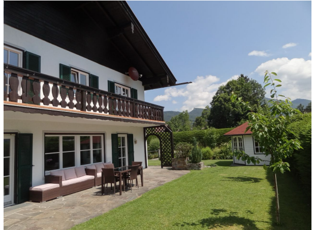
Außenansicht mit Terrasse