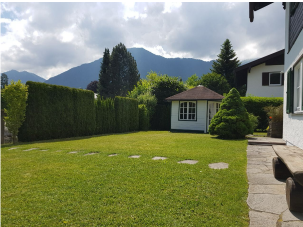
Garten mit Blick Richtung Süden