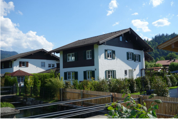
Außenansicht mit Bachlauf