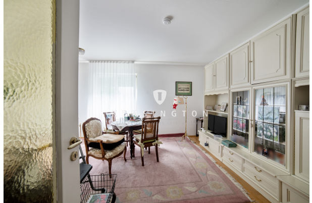
Einbauschränk im Wohnzimmer