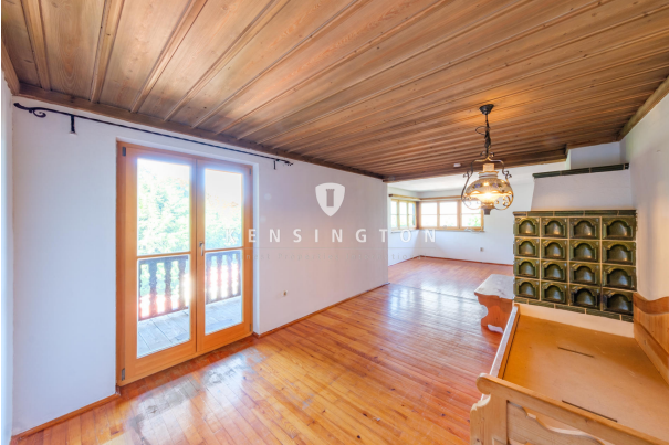
Wohnbereich mit Zugang Balkon