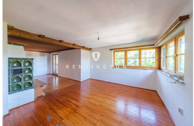
Wohnbereich von der Küche aus gesehen