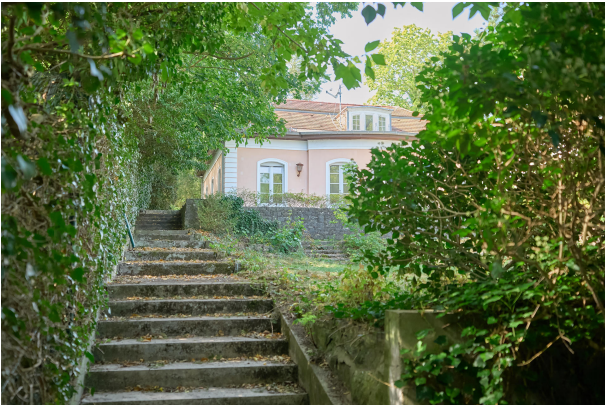
Unverbaubare Lage am See