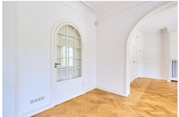
Möglicher Umbau zur Küche