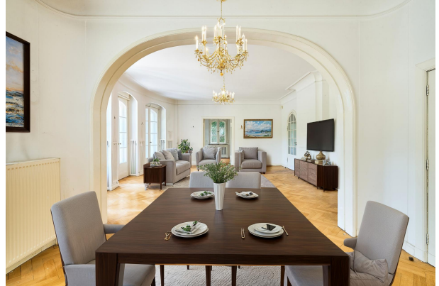
Wohnzimmer mit Kamin