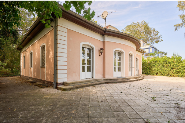
Große Terrasse zum Genießen