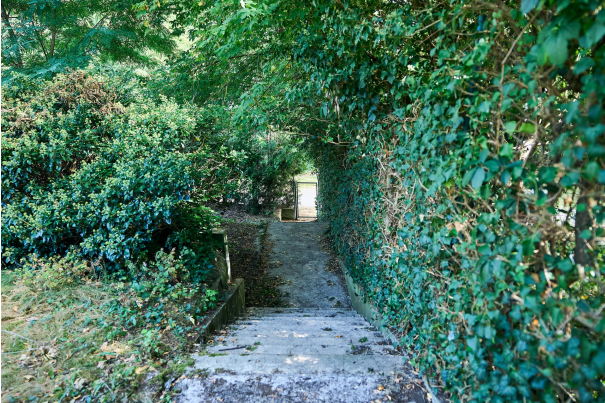
Blick von unten zum Haus