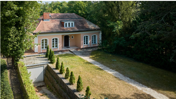
Eingang und Einfahrt auf das Grundstück