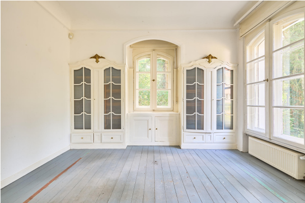
Küche mit Terrassenausgang