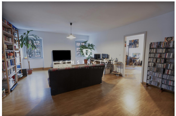
Blick ins Grüne!