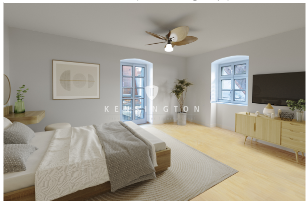
Ihr neuer Schlafbereich (Einrichtungsbsp.)!