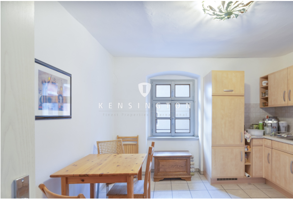
Mit Platz für einen großen Esstisch!