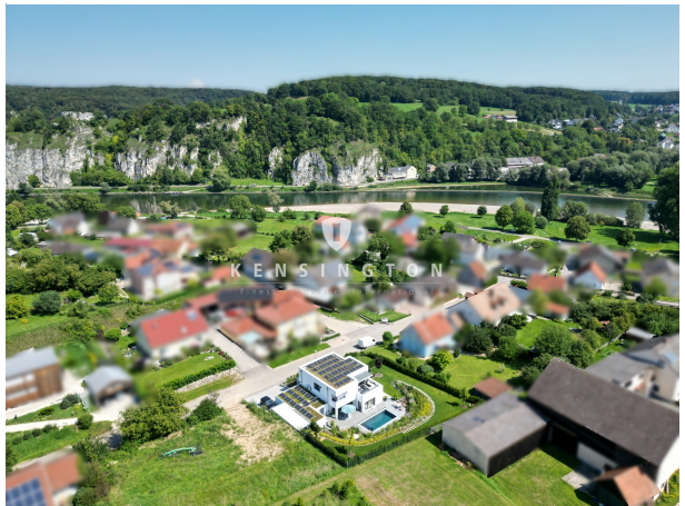
Traumhaft ruhige Lage in Stausacker!