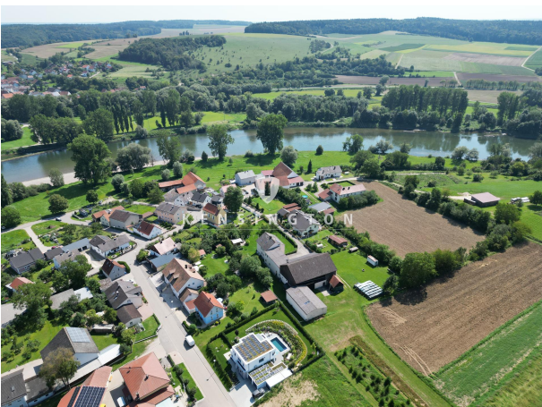
Die letzten Sonnenstrahlen!