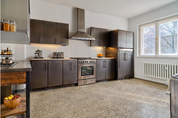
Visualisierung Wohnbeispiel Küche