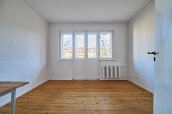
Schlafzimmer mit Balkon