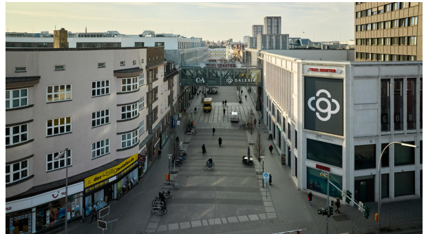
Leben am Tegel Quartier