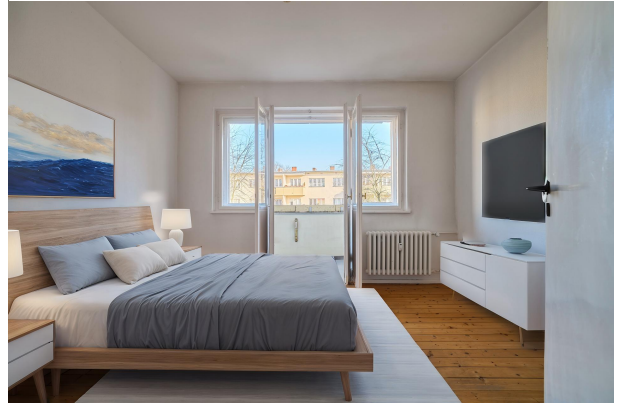
Visualisierung Wohnbeispiel Schlafzimmer mit Balkon