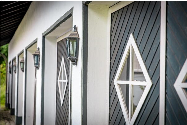
tiefe Garagen mit elektrischen Tooren