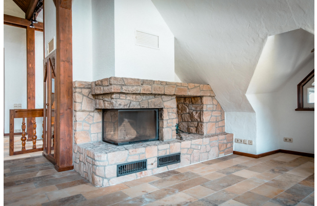
Zimmer Beispiel 1. Etage