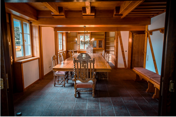
5 Meter Tafel im Esszimmer