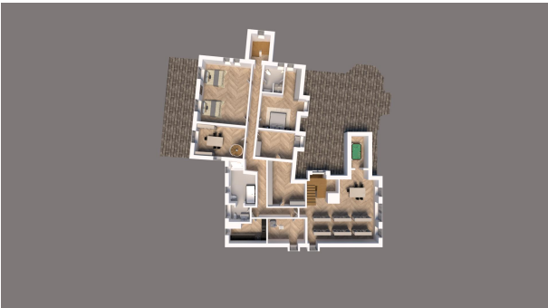
Garage 1. ET