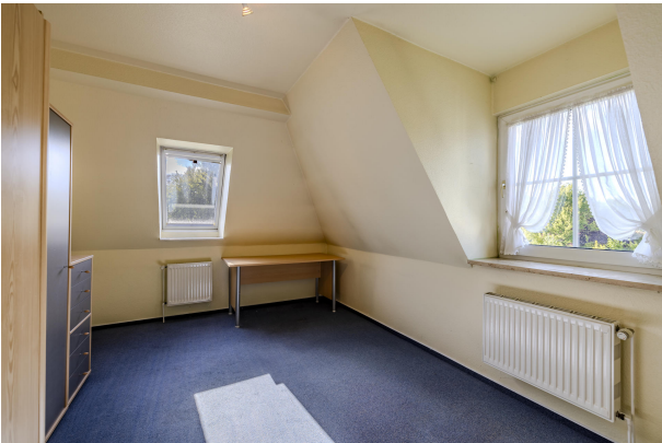
Schlafzimmer Nr. 2DG